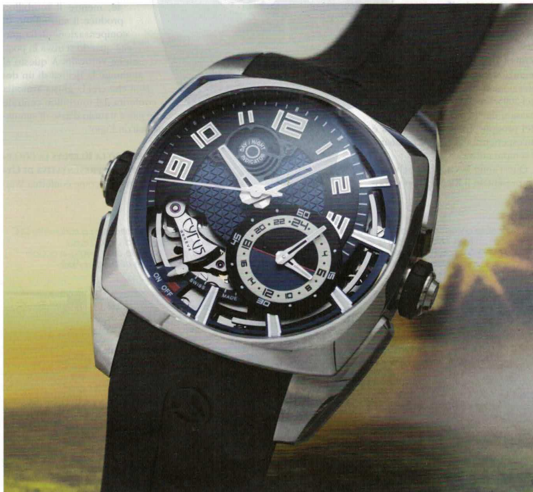
Il Klepcys Alarm di Cyrus Watches è stato presentato quest'anno in questo nuovo allestimento con cassa, lunetta e fondello in acciaio e quadrante blu (prezzo di 33.300 euro).

to presentato in una nuova variante con quadrante blu e cassa realizzata interamente in acciaio, anziché in acciaio e titanio. Come il cronografo, anche i Klepcys Alarm sono dotati della doppia corona, uno dei segni distintivi della collezione Klepcys, ma in questo caso quella ad ore 9 è puramente estetica, mentre quella a ore 3 è utile, in prima posizione, alla regolazione dell'orario della